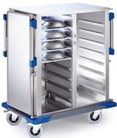
TTW-F 16-105 DSZG

Liegt gut in der Hand und in der Spur. Die langen, senkrecht angeordneten Schiebegriffe sorgen für optimales Handling. Ob groß oder klein – hier kommt jeder mit geringem Krafteinsatz schnell vorwärts. Die Schiebegriffe sind auch bei geöffneter Tür zugänglich.