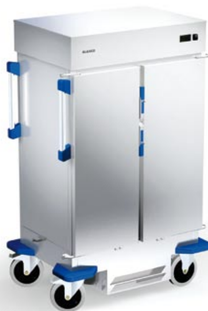
TTW-FK 16-115 DSZE (Illustration)

Schonende und gradgenaue Temperaturregulierung von +30 °C bis +75 °C.